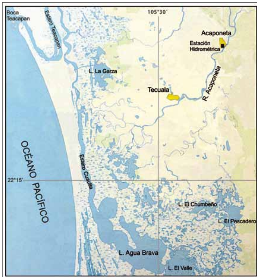
Figura 1. Ríos Acaponeta y Las Cañas. Cuenca de Agua Brava.

marismas y pantanos que pertenecen a la región costera de los Marismas Nacionales (Bojórquez et al. , 2004), descarga en los sistemas lagunares y estuarinos de: Agua Brava, El Valle y Las Garzas, así como los esteros: El Salado, El Indio y El Gavilán. En esta zona se sitúa una extensa área sujeta a inundación, a unas decenas de kilómetros de la playa el Novillero. La longitud del río Acaponeta es de aproximadamente 233 km desde su nacimiento hasta la barra El Novillero ( Ibid. ).