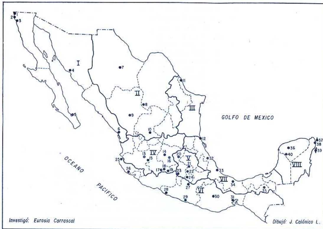
MAPA I. Principales centros turísticos de México dentro de las zonas geoeconómicas

socio-económico del país y, en general, los servicios públicos que necesita una población o lugar determinado, surgen en la mayoría de los casos como resultado del desarrollo turístico de ese lugar.